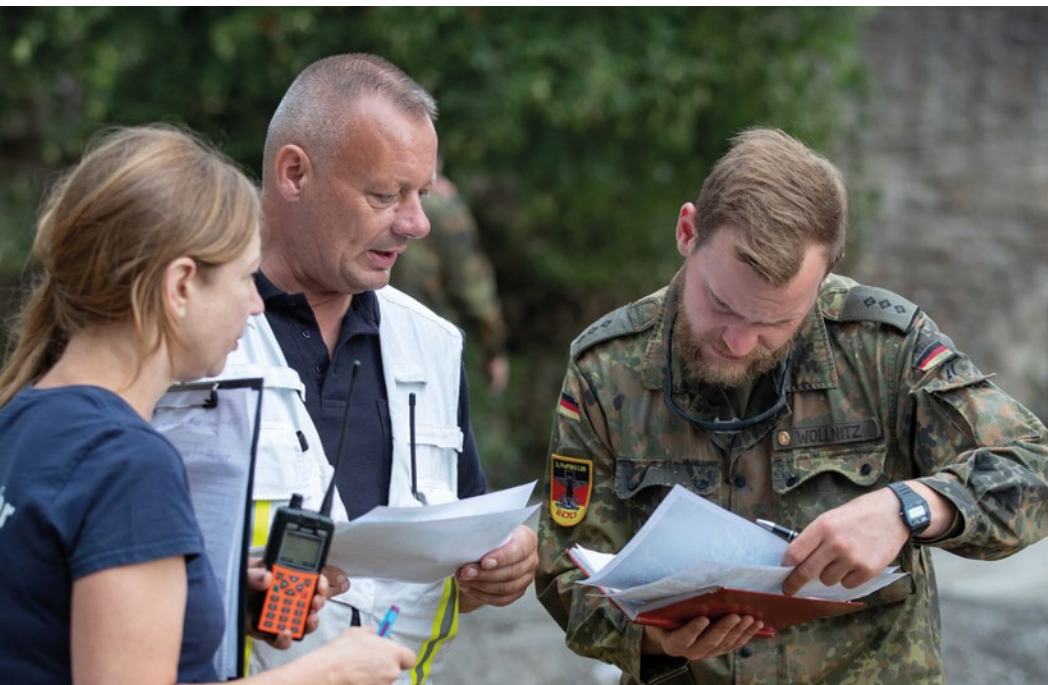
Die Bundeswehr unterstützt bei den Aufräumarbeiten nach der Hochwasserkatastrophe im Ahrtal.

»Die Bundesregierung wird ihre Cyber- und Weltraumfähigkeiten sowie ihre Weltraumlagefähigkeiten erweitern, damit diese einen wesentlichen Beitrag zu kollektiver Abschreckung und Verteidigung in der NATO leisten können.