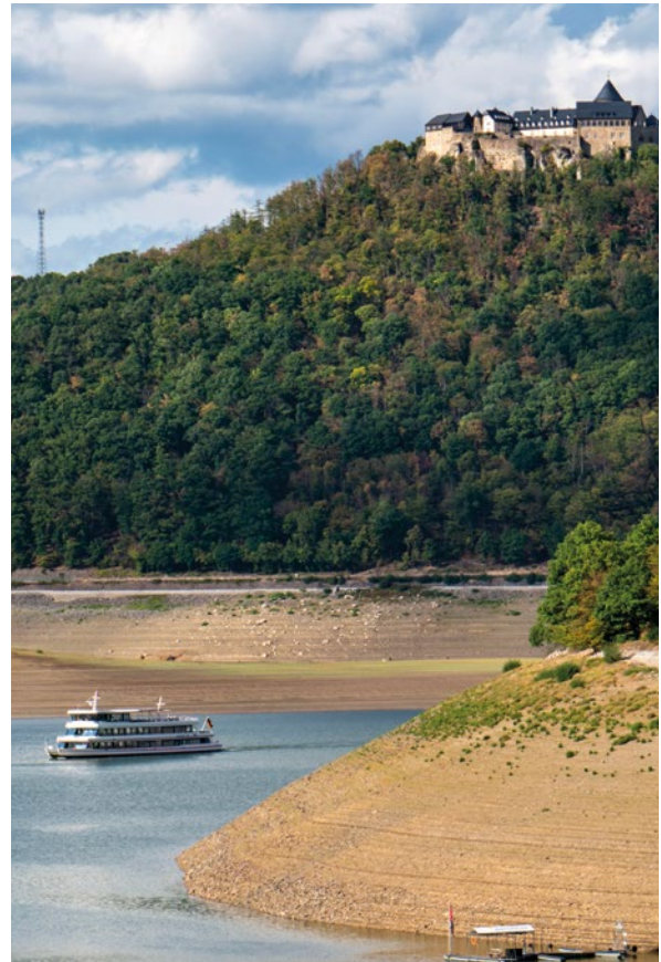
Die Folgen der Klimakrise wurden für Menschen und Natur besonders in den letzten Jahren weltweit deutlich spürbar – auch in Deutschland.