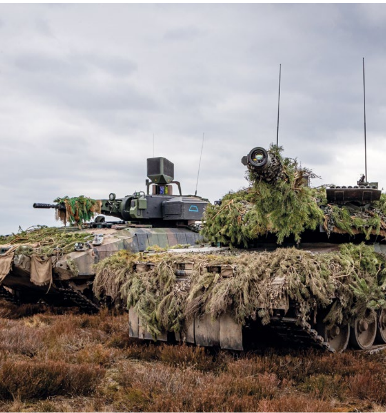
Schützenpanzer Puma und Kampfpanzer Leopard der Bundeswehr

Glaubwürdige Abschreckungs- und Verteidigungsfähigkeit im transatlantischen Bündnis der NATO ist das unverzichtbare Fundament deutscher, europäischer und transatlantischer Sicherheit. Die NATO ist oberste Garantin für den Schutz vor militärischen Bedrohungen. Sie verbindet Europa politisch mit Nordamerika. Zweck des Bündnisses ist es, die Menschen im Bündnisgebiet zu schützen und unsere Sicherheit, unsere Werte und unsere demokratische Lebensweise zu verteidigen. Wir stehen unverbrüchlich zum Versprechen auf gegenseitigen Beistand nach Artikel 5 des Nordatlantikvertrags. Unser Bekenntnis zur NATO und zu unseren Verpflichtungen im Bündnis ist unverrückbar. Dies gilt ebenso für unser Bekenntnis zur EU-Beistandsklausel aus Artikel 42, Absatz 7 des Vertrags über die Europäische Union, sowie unsere gegenseitige Beistandspflicht mit Frankreich aus Artikel 4 des Vertrags von Aachen.