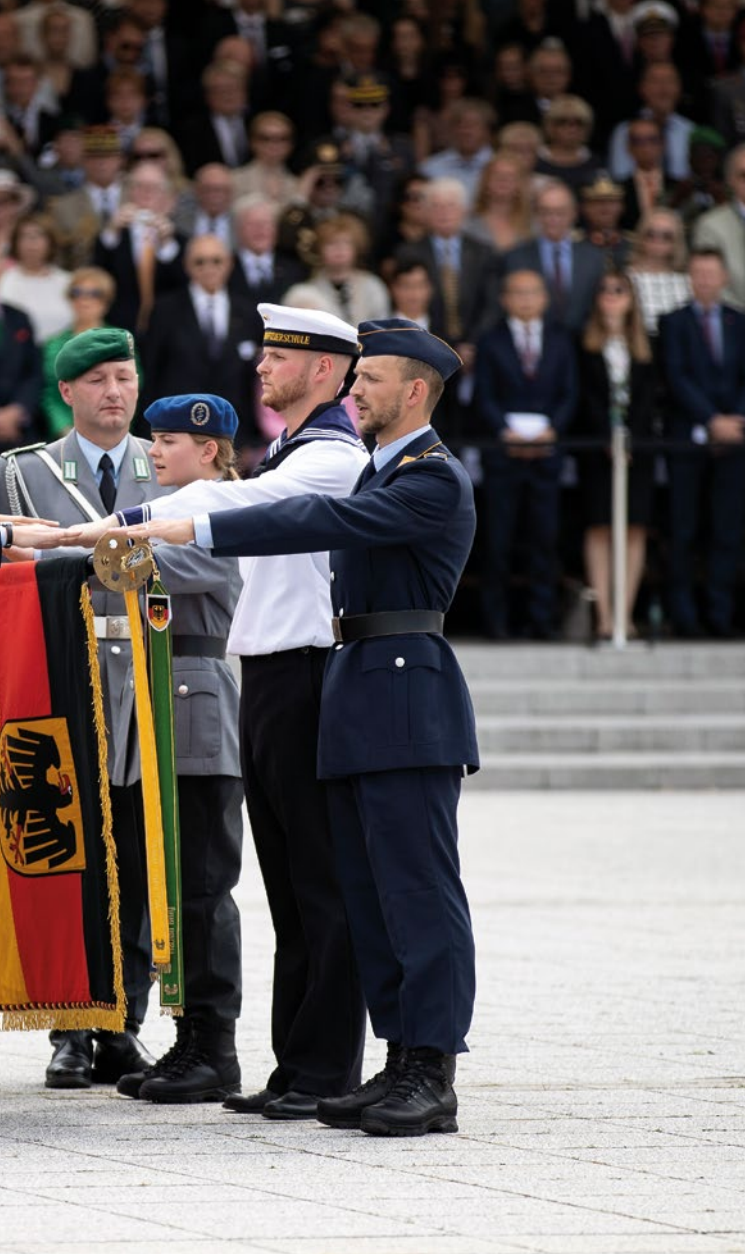
Rekrutinnen und Rekruten der Bundeswehr legen ihr Gelöbnis ab.

Mitgliedschaft in EU und NATO, unserem auf sozialer Marktwirtschaft und internationaler Verflechtung basierendem Wirtschaftsmodell und der Verantwortung für unsere natürlichen Lebensgrundlagen. Auf dem festen Fundament unserer Werte bestimmen wir diese Interessen: