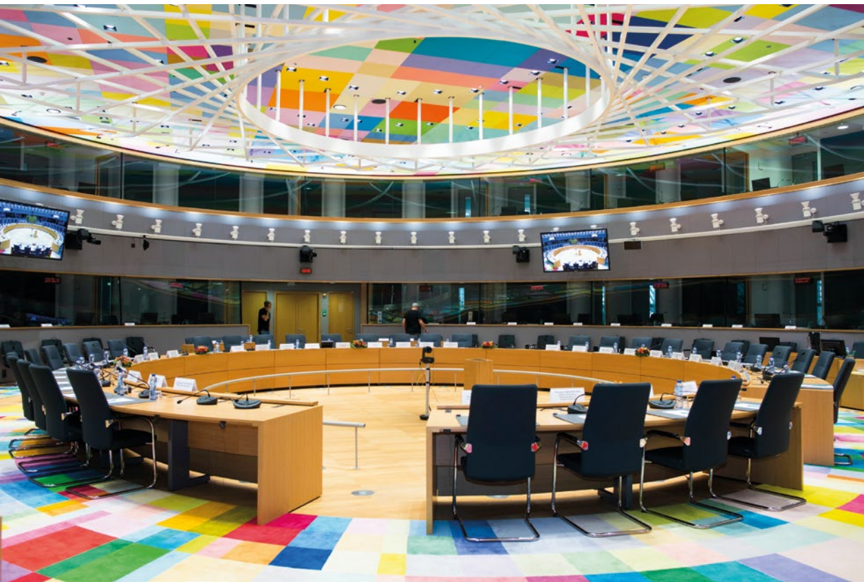
Sitzungssaal des Europäischen Rates in Brüssel