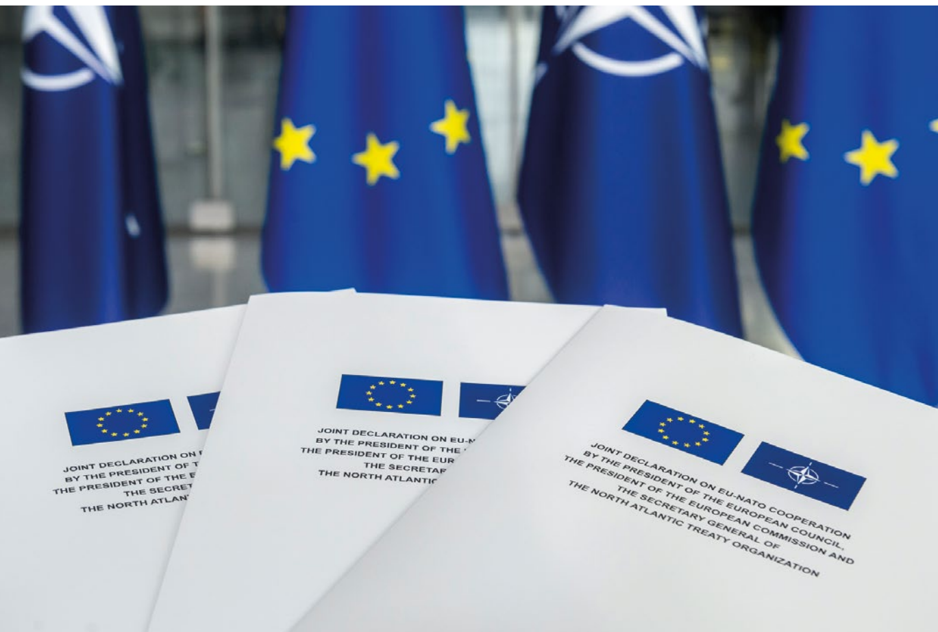
Gemeinsame Erklärung zur Zusammenarbeit zwischen der EU und der NATO