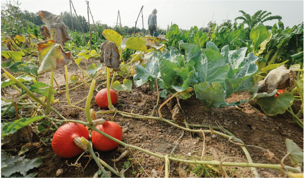
Die Bundesregierung setzt sich für eine Transformation hin zu nachhaltigen und widerstandsfähigen Agrar- und Ernährungssystemen ein.

hinweg erforderlich. Dazu bedarf es auch einer Verbesserung der globalen Governance von Agrar- und Ernährungssystemen, insbesondere der Ernährungs- und Landwirtschaftsorganisation der Vereinten Nationen und des Welternährungsausschusses. Dadurch können mehrere Ziele erreicht werden: eine Landwirtschaft, die nährstoffreiche Nahrungsmittel produziert, die aber auch weniger Treibhausgase verursacht und die Biodiversität schützt. Gleichzeitig trägt aktiver Klimaschutz dazu bei, die Produktion zu sichern und das Recht auf Nahrung zu verwirklichen – zualererst für besonders betroffene Kleinbäuerinnen und -bauern. Eine nachhaltige Umgestaltung zielt auch darauf ab, dass lokale und regionale Agrar- und Ernährungssysteme unabhängiger von weltweiten Krisen und Konflikten sind und durch bessere Anpassung an die Klimakrise einen größeren Beitrag zur Ernährungssicherung der lokalen Bevölkerung leisten können. Damit dies nicht in Protektionismus und die dadurch