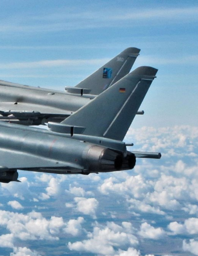
NATO-Luftraumüberwachung im Baltikum