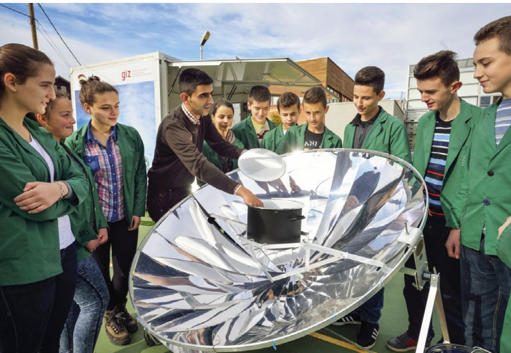
Schülerinnen und Schüler in Pristina lernen, mit Solartechnik der Klimakrise zu begegnen.

Die globale Krise unserer Lebensgrundlagen erfordert eine Antwort, an der sich alle Staaten beteiligen. Ziel der Bundesregierung ist es deshalb, globale und ambitionierte Lösungen zu finden. Dies schließt den Dialog mit allen relevanten Akteuren ein. Technologieoffenheit ermöglicht dabei Handlungsfreiheit für uns und kommende Generationen.