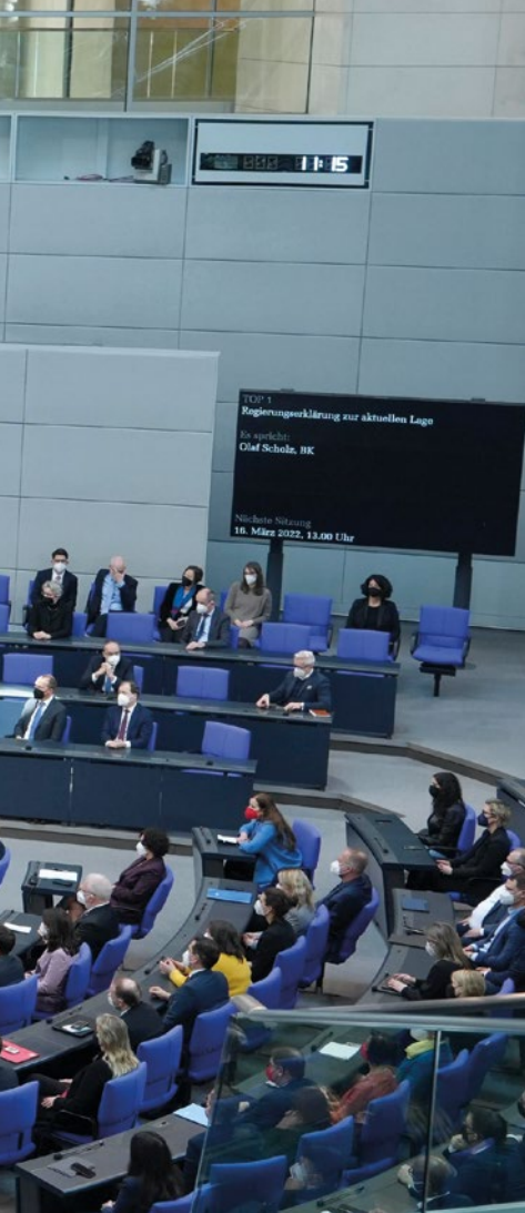
Debatte zur „Zeitenwende“: Plenarsitzung des Bundestags am 27.02.2022

nicht komplett verhindern, sondern nur noch eindämmen. Zugleich liegen große Chancen in einer nachhaltigen, grünen und sozial gerecht ausgestalteten Transformation, die nicht nur saubere Energie und gesicherte Ernährung, sondern auch weniger Abhängigkeiten bedeutet.