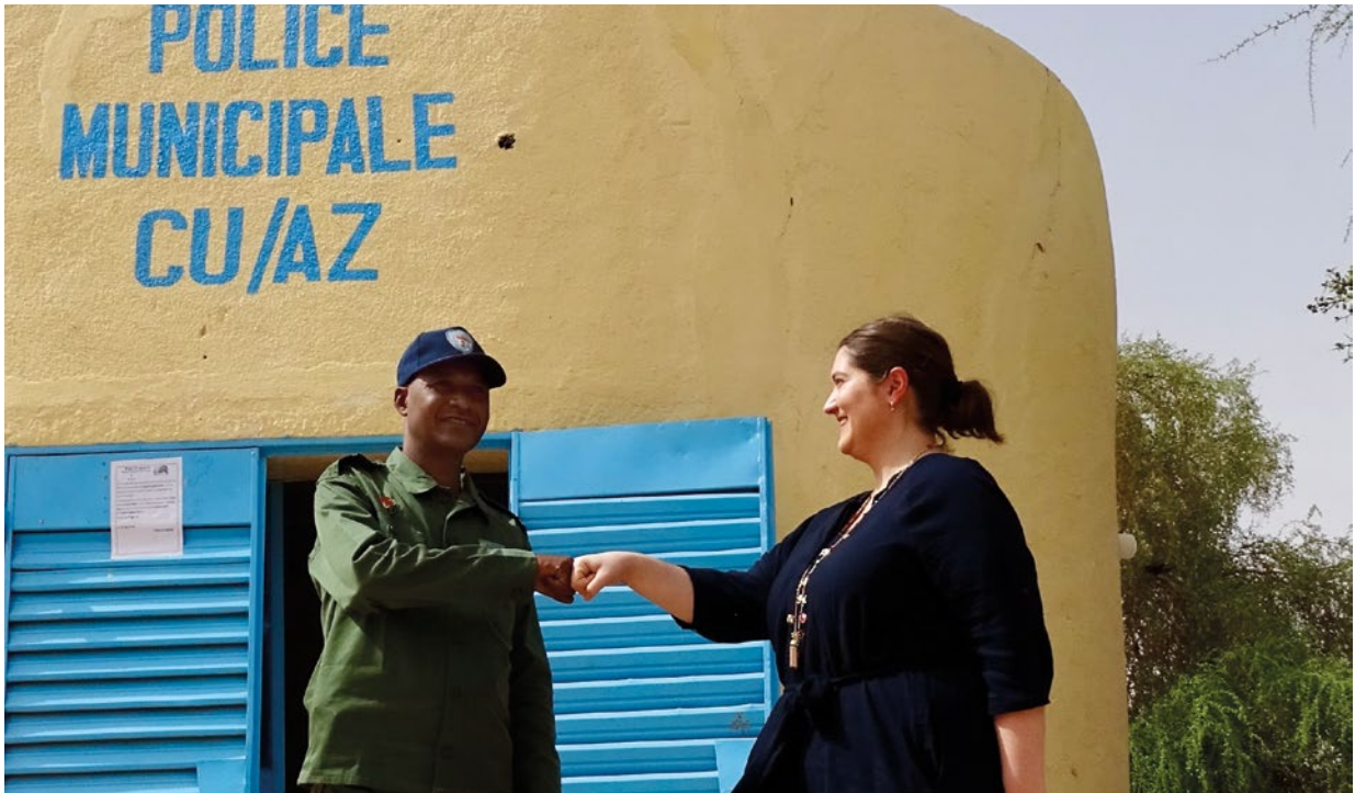
Deutschland entsendet ziviles und polizeiliches Personal in die Mission EUCAP Sahel Niger zur Unterstützung nigrischer Sicherheitskräfte bei der Bekämpfung von Drogen-, Waffen- und Menschenmuggel.

Anspruch der Bundesregierung ist es, in allen Phasen eines Konflikts politische Prozesse zu dessen Lösung zu fördern und mit Hilfe unserer Instrumente Anreize für Ausgleich und Versöhnung zu setzen. Dabei setzen wir zuvorderst auf Prävention, indem wir die strukturellen Ursachen von Konflikten angehen und friedensfördernde Akteure stärken. Die Bundesregierung übernimmt Verantwortung für internationales Krisenengagement im Rahmen ihrer Bündnisse und der internationalen Organisationen.