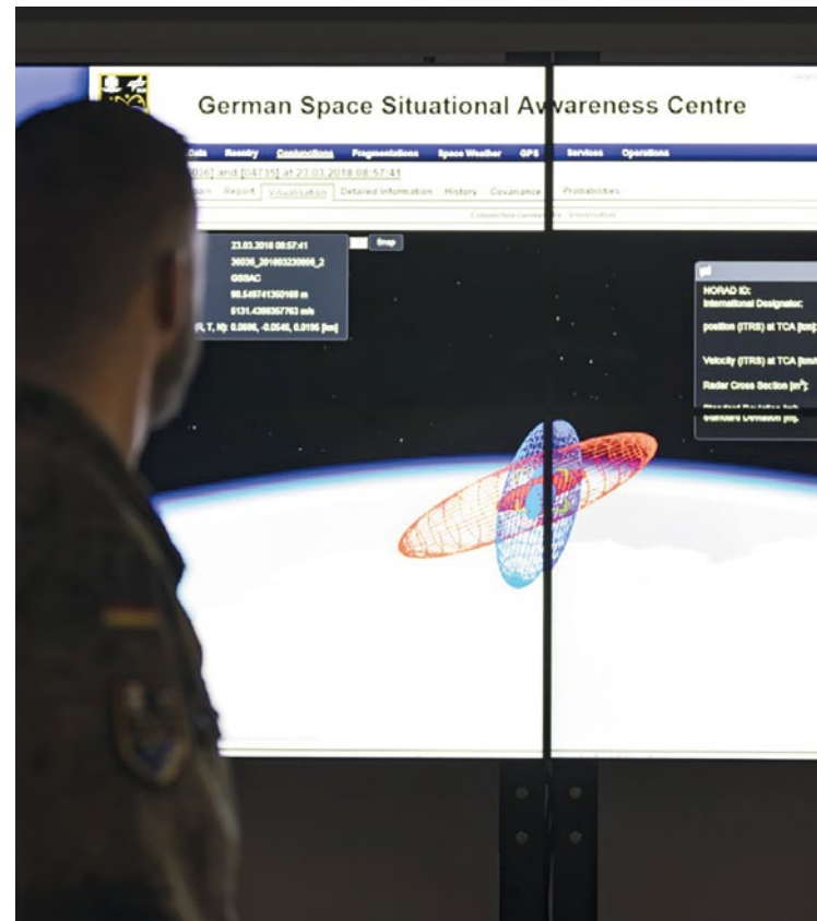
Vom Weltraumlagezentrum in Uedem aus schützt die Bundeswehr gemeinsam mit dem Deutschen Zentrum für Luft- und Raumfahrt zivile und militärische Systeme im Weltraum.

»Die Bundesregierung wird das Weltraumlagezentrum ausbauen. Um lageangemessen auf Vorfälle im Weltraum reagieren zu können,